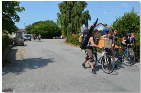
Billede 2 - Min spejder gruppe er på sommerlejr på Ærø.

Man er god til at samarbejde med andre, og man er ikke bange for at blive beskiddt. Især i navigationstimerne, hvor man skal lære om kort og kompas, har jeg haft en kæmpe fordel, måske også fordi jeg er orienteringsløber, men grunden til at jeg startede på orienteringsløb var på grund af at jeg var spejder.