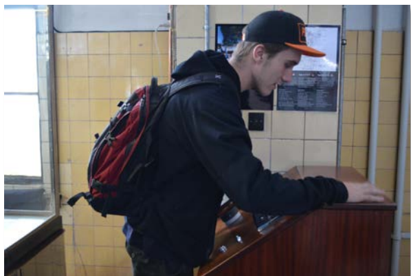
Billede 2 - På studieturen til København besøgte vi også Diesel House, med mange spændene motorer.

Mange af mine kammerater er dog blevet så bidt af det, at de allerede har bestemt at søfart er det rigtige for dem.